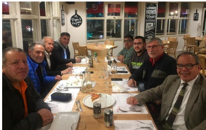
Primera reunión de Directorio Club Satélite

Como comité editorial deseamos mucho éxito en la labor a desarrollar frente a los grandes desafíos que se presentan.